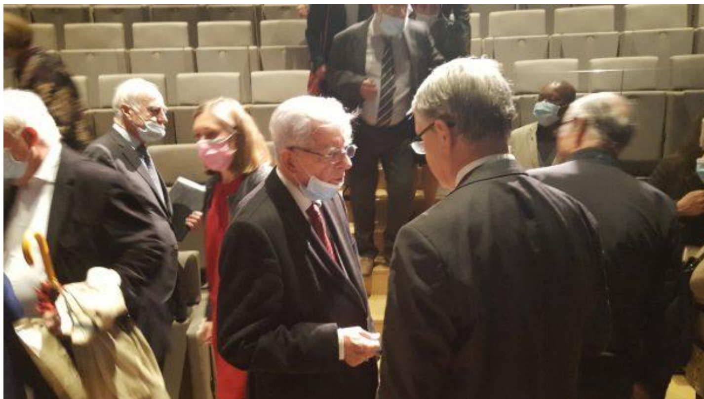
M.J-P.Chevènement avec M.L.Kadychev en fin de présentation